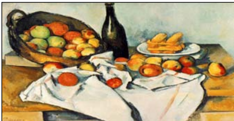
Panier de pommes, nature morte, 1890 - 94

5. Cézanne n'apprécie pas les discussions du café Guerbois où les artistes se retrouvent. Il déteste le Salon qui refuse toutes les toiles qu'il propose. Il n'aime pas Paris qu'il quitte sans cesse pour retrouver le Sud.