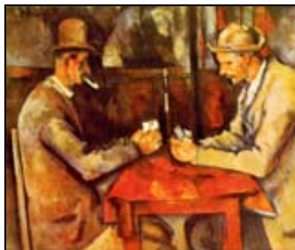
Les joueurs de cartes, 1890 - 92

9. Cézanne se fâche souvent avec ses amis. Mais tous lui reconnaissent du génie. Grâce à lui, les jeunes peintres inventeront le fauvisme, le cubisme, l'art abstrait. Le 15 octobre 1906, Cézanne peint dehors, comme d'habitude. Un violent orage le surprend. Il ne veut pas cesser de peindre. Il prend froid et deux jours après, meurt.