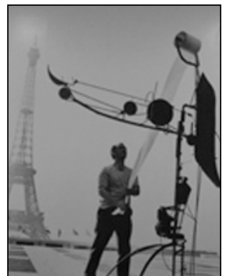
En pleine action